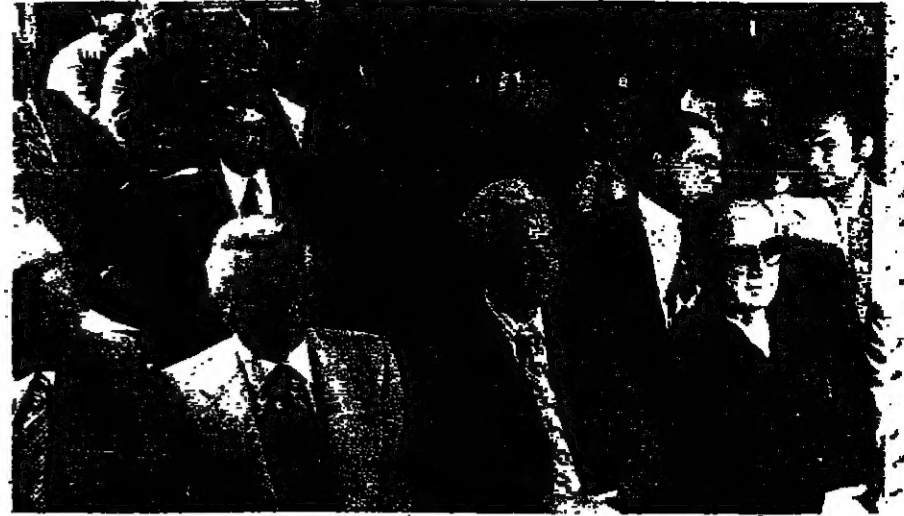
جانب من النواب داخل القاعة